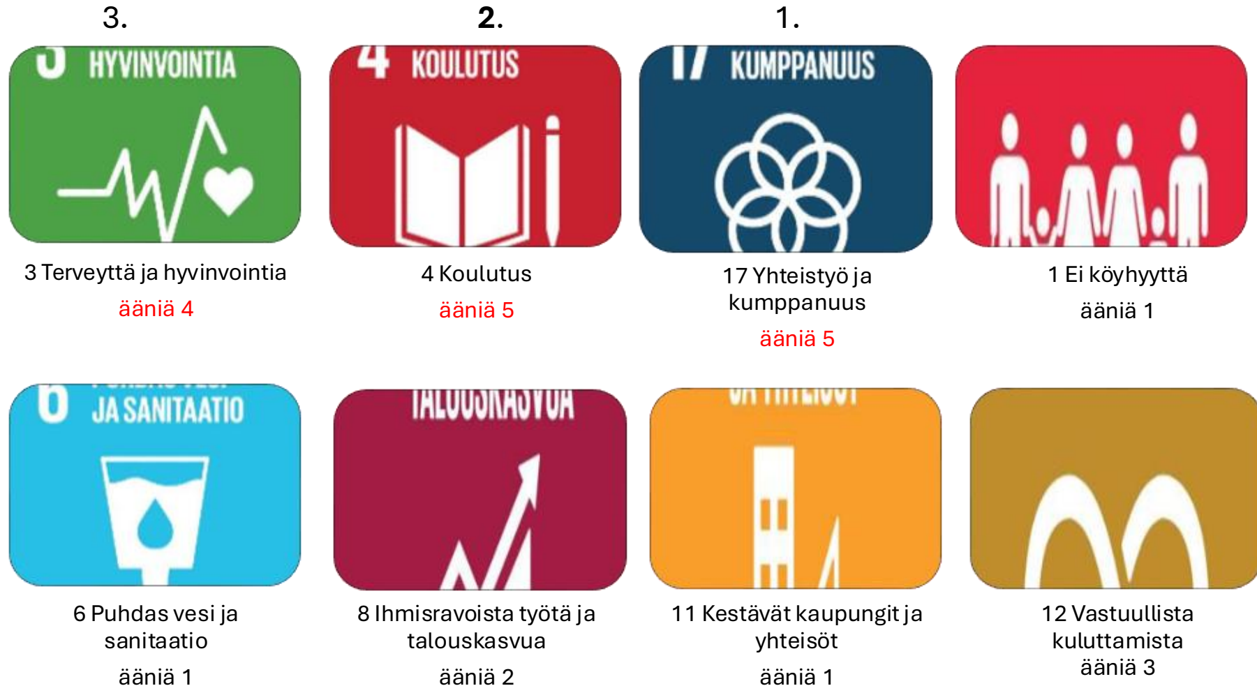
Kuva 1. Tavoitteiden valinta

Kyselyn perusteella valitut tavoitteet 19.9.2025